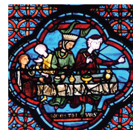
1- Escultura románica 2- Inscripción carolingia 3- Vitral gótico